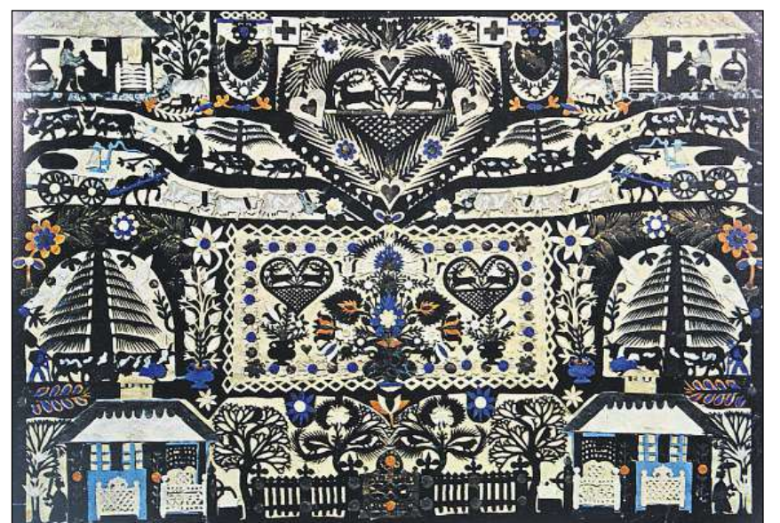
Ina da las ovras classicas da Johann Jakob Hauswirth.

Tradiziunalmain vegnan ils retagls realisads en in toc, en nair ed alv – in tagl da siluetta po però er avair nianzas da color u formats fitg differents e vesair ora mintgant sco ina collascha da palpiris colorads. Aderents da la tradiziun musan plitgusch scenas d'ina chargiada d'alp u da la produziun da chaschiel, preschentan ils conturns tradiziunals cun chalets e cun chasas da lain u fan musters da flurs u cumposiziuns geometricas. Ils artists moderns da tagls da siluetta prefereschan motivs asimmetric, grafics ed abstracts.