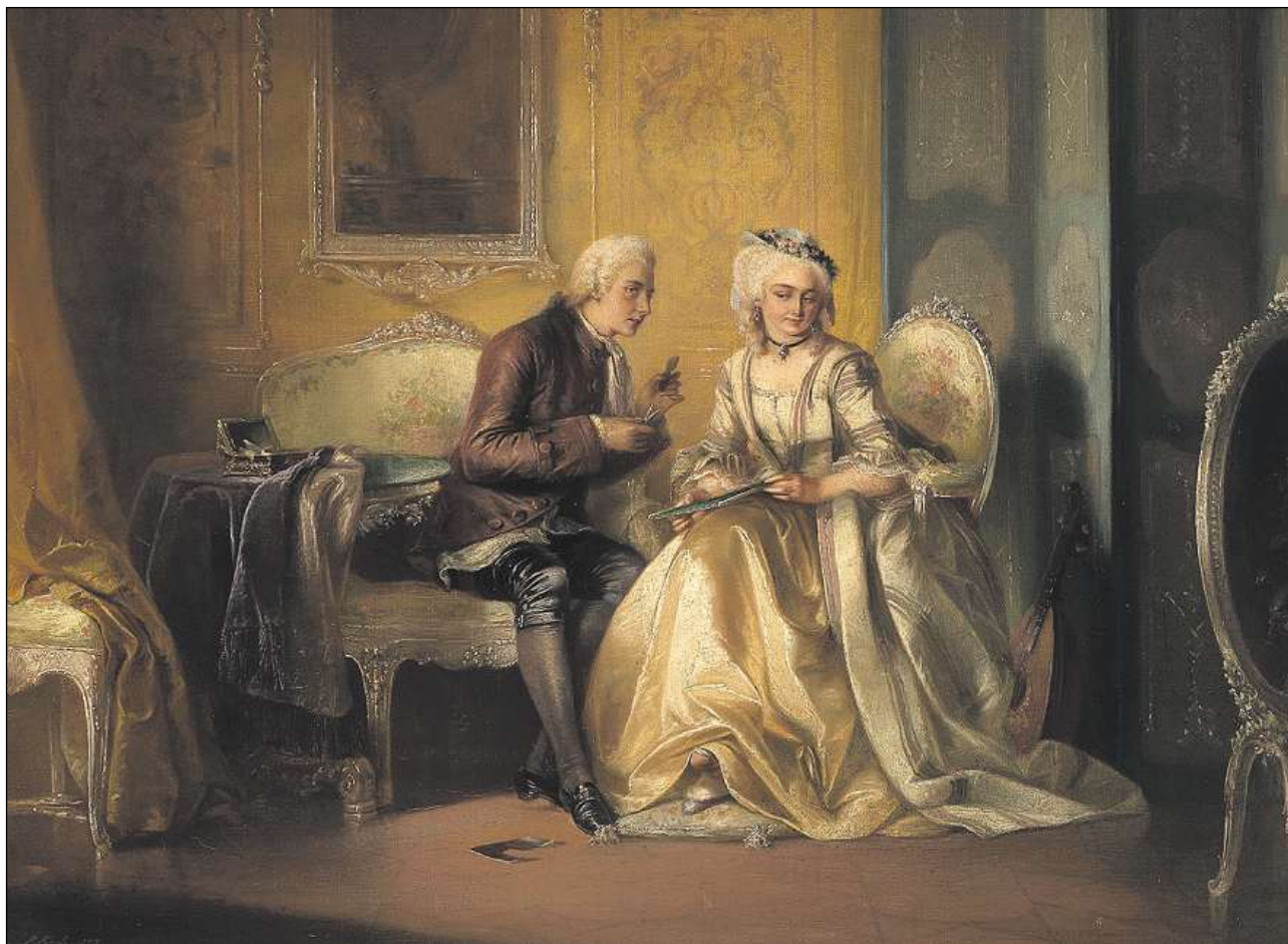
In artist da palpiri taglia la siluetta d'ina dama aristocrata.